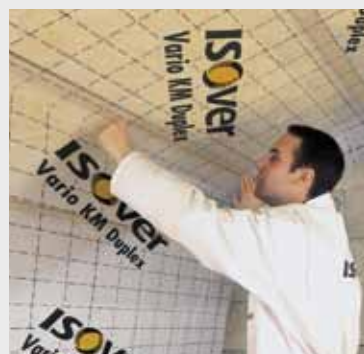
Fig. 4 Breng een lucht/dampscherm aan, zoals Isover vario KM duplex. Appelez un pare-vent/ vapeur, comme l' Isover vario KM duplex.