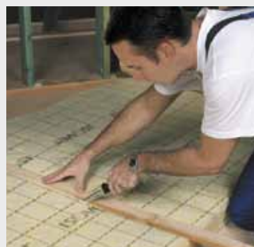
Fig. 2 Snij de gewenste breedte langs de maatstrepen af met een lat en het Isover isolatiemes. A l'aide du couteau Isover coupe laine et d'une latte, coupez à dimension en suivant les prémarquages.