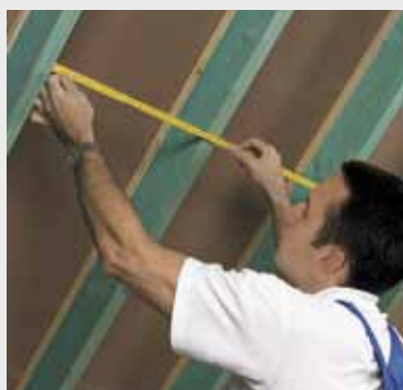
Fig. 1 Meet de ruimte tussen 2 kepers en voeg hier 1 à 2 cm aan toe. Mesurez la distance entre 2 chevrons et ajoutez-y 1 à 2 cm.

L'application d'un pare-vent/vapeur est indispensable pour assurer l'étanchéité à l'air et à la vapeur d'eau (fig.4). Le pare-vapeur à base de polyamide au pouvoir asséchant est décrit dans la fiche Isover vario KM duplex.