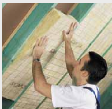
Fig. 3 Klem de isolatie tussen de kepers. Coincez l'isolation entre les chevrons.